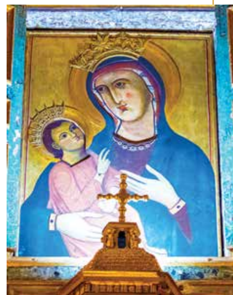
A templom legfontosabb kincse a Sancta Maria Antiqua-templomból való, és a sekrestyében található: az az 5. századból származó Mária-ikon, amelyet a rómaiak Úti Boldogasszonynak neveznek, hiszen a földi zarándokúton segíti lépteinket. A főoltár felett a 12. századi élethű másolat tekinthető meg. Ezt 1950-ben egy felújítás során találták meg, miután eltávolítottak egy 19. századból származó festményt.