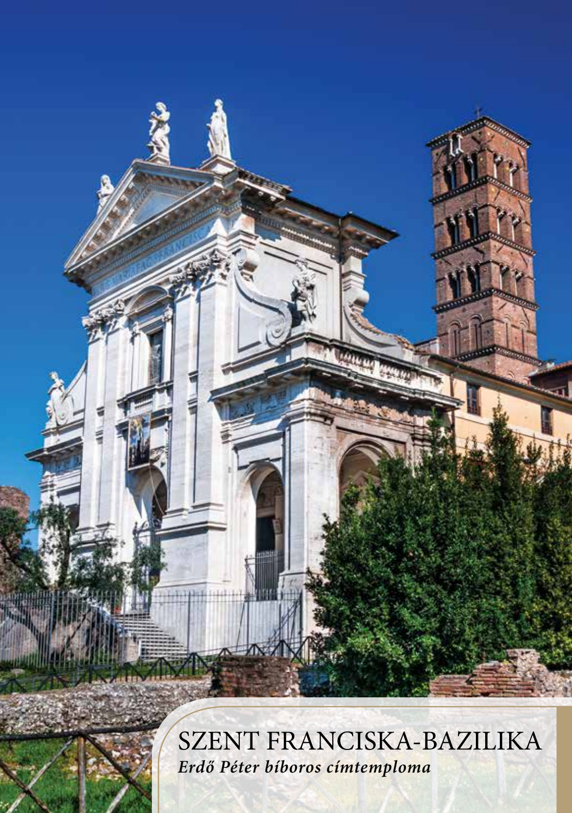
SZENT FRANCISKA-BAZILIKA Erdő Péter bíboros címtemploma