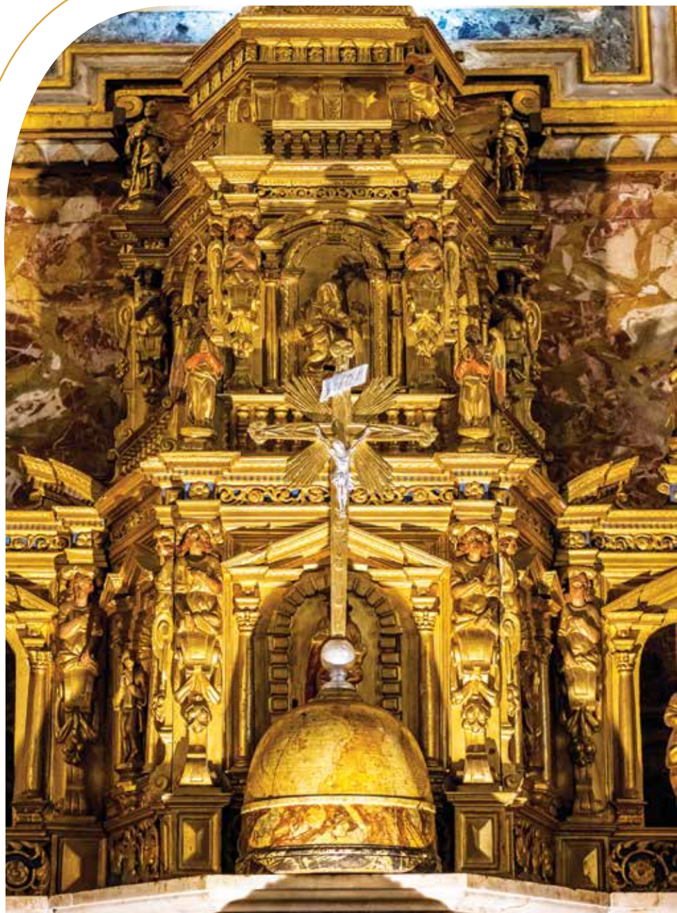
A templom főoltárát az a barokk mester - név szerint Gian Lorenzo Bernini - tervezte, aki a Szent Péter-bazilika főépítészje volt, valamint a Szent Péter tér kialakításánál is komoly szerepet vállalt.